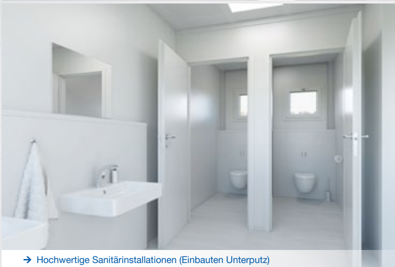
→ Hochwertige Sanitärinstallationen (Einbauten Unterputz)