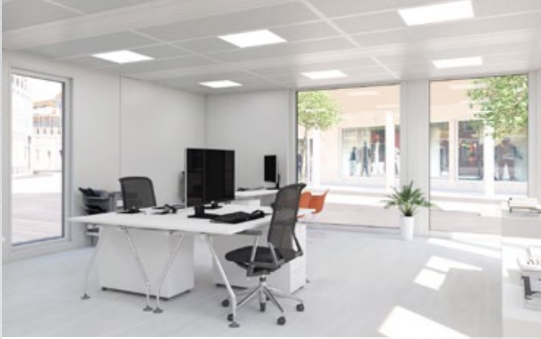
→ Helle Räume dank Vollverglasung